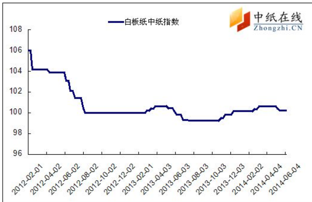
图 1: 白板纸中纸指数走势图

2014年6月6日白板纸价格指数为100.26,与上周持平,较周期内最高点106.02(2012-2-1)下降了5.76%。